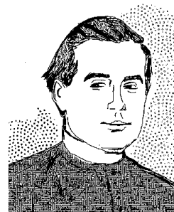
Venerable Eladio Mozas Santamera

La sabiduría del trabajo , donde se revela la profundidad de todo lo humano y donde la creatividad se hace cómplice de los dedos del Creador, para salir de nuestra desidia, apatía, indolencia... Aprender de José la alegría y la dignidad del trabajo bien hecho, con las manos y con el corazón.